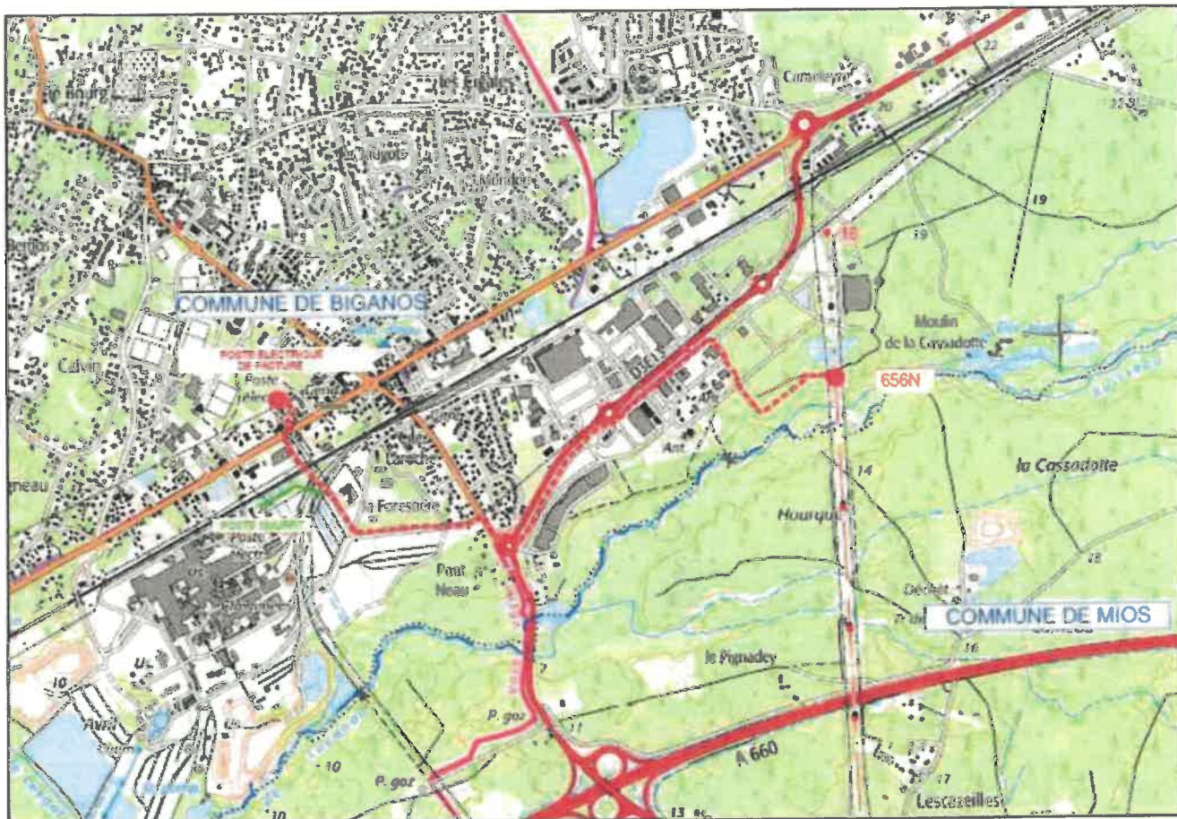
Liaison aéro-souterraine à 63 000 Volts FACTURE- MASQUET - Plan de la ligne souterraine au 1 / 25 000